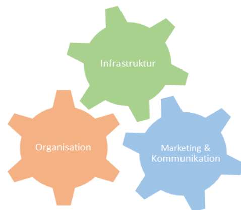
Grafik 1: Maßnahmen - Mix

Für die Auszeichnung mit dem Mobil-Siegel ist der Mix aus verschiedenen Maßnahmen wichtig. Denn eine Radförderung, die keiner kennt, kann keine Wirkung entfalten, genauso wenig wie ein mobiler Arbeitsplatz, wenn Konferenzen nur als Präsenztermin geplant werden. Rabatte bei Car-Sharing-Anbietern sind wirkungslos, wenn man nicht weiß, wo der nächste Car-Sharing-Parkplatz ist. Die Beispiele verdeutlichen: Ein Mix aus verschiedenen Maßnahmen ist wichtig, damit die ergriffenen Maßnahmen auch ihre Wirkung entfalten können. Diesen „Maßnahmen-Mix“ stellen wir in den Mittelpunkt, indem Maßnahmen aus den Bereichen „Marketing & Kommunikation“, „Organisationskultur“ und „Infrastruktur“ für eine Auszeichnung vorhanden sein müssen und bewertet werden.